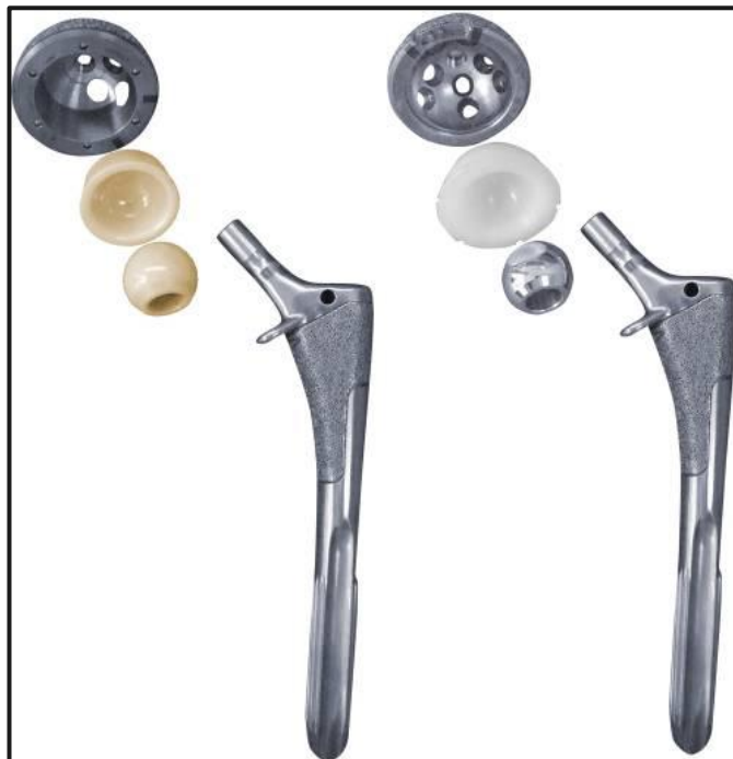
Figura 2 [33] mostra à esquerda componente da cabeça femoral e do acetábulo de cerâmica e à direita cabeça femoral metálica com componente acetabular de polietileno. Exemplos de materiais de revestimento usados em diferentes marcas na artroplastia de quadril.