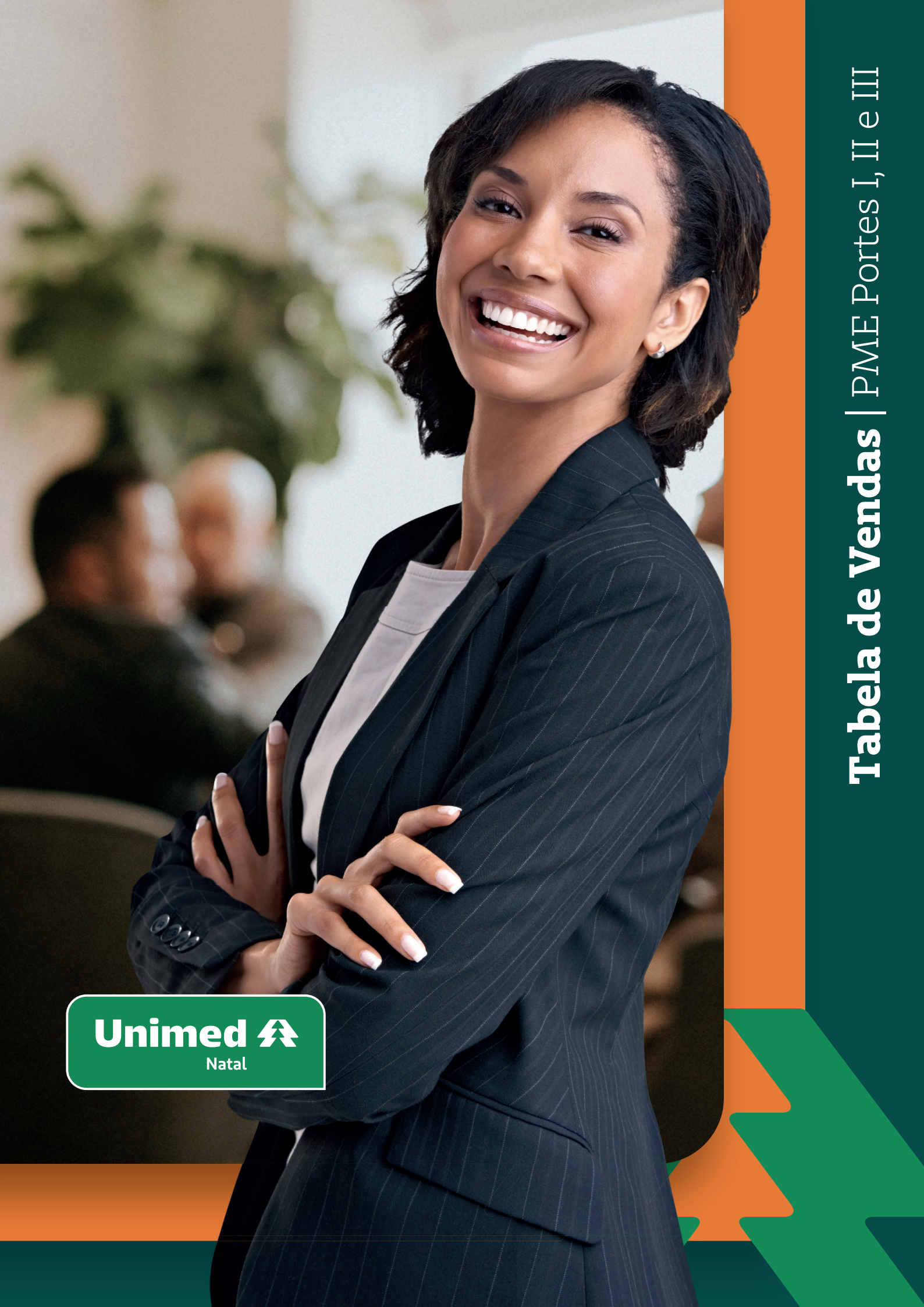
Tabela de Vendas | PME Portes I, II e III