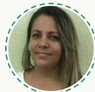
CAROLINA CINE PRIMO Técnico de Enfermagem Central Mat. Esterilizado