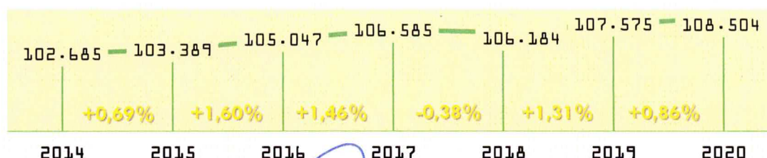
Gráfico - Evolução de Beneficiários - Unimed Campo Grande

O ano de 2020 foi marcado com o início da maior pandemia de saúde já ocorrida nas últimas décadas. Como já demonstramos em comunicados anteriores, a restrição da circulação de pessoas provocou um arrefecimento nas atividades econômicas e aversão ao risco por parte dos investidores. Dessa forma, o primeiro semestre foi marcado por uma elevada contração econômica e o segundo semestre por uma retomada parcial. A contração econômica provocou desemprego e redução no consumo das famílias. Segundo dados divulgados pelo Ministério da Economia, Campo Grande, cidade em que está a maior parcela dos beneficiários da Unimed CG, registrou no primeiro semestre de 2020 uma retração de 3,13% nas vagas ocupadas de trabalho, porém, no segundo semestre teve uma evolução de 3,75%, finalizando o ano com um crescimento líquido de 0,50%. Esse comportamento foi muito similar ao desempenho da evolução dos beneficiários da Unimed CG. O primeiro semestre foi marcado por uma retração na carteira de 0,31% e o segundo semestre com uma evolução de 1,18%, finalizando o ano com crescimento geral da carteira de 0,86%.