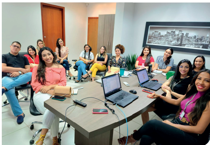
Treinamento para a atualização do Sistema Solus

Com o objetivo de avaliar e atender as demandas de diferentes departamentos da Unimed Araguaína, permitindo, assim, o aperfeiçoamento dos serviços prestados aos cooperados e clientes, a cooperativa recebeu a visita técnica da empresa Solus Saúde.