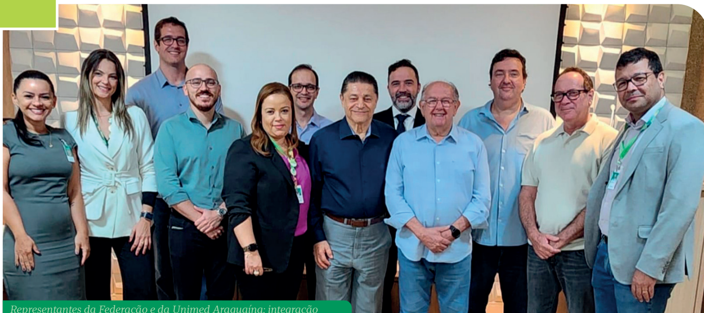
Representantes da Federação e da Unimed Araguaína: integração