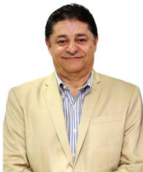
Dr. Luiz Carlos de Oliveira Presidente

Foi um encontro muito produtivo, bem organizado e que reuniu especialistas em saúde, economia, cooperativismo e empreendedorismo para debater com os integrantes do Sistema Unimed temas, como o cenário da saúde suplementar no Brasil. Além de novos conhecimentos, do intercâmbio de informações e da atualização profissi-