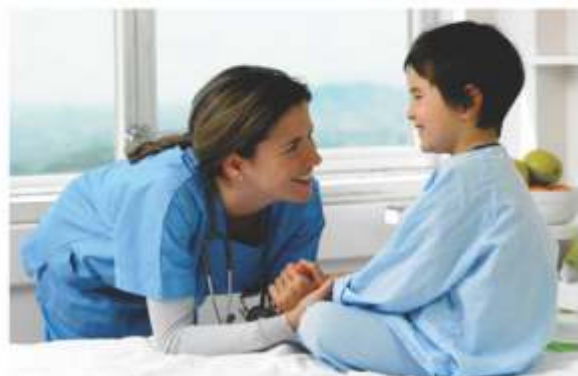
Descontos em vacinas: proteção da saúde e economia

Os descontos oferecidos aos clientes, cooperados e colaboradores da Unimed Araguaína variam de 5% (para pagamento em cartão ou cheque pré-datado para 30 dias) a 18% (para pagamentos à vista). Quem não estiver com o cartão de vacinação em dia pode comparecer a Vacinaclean - localizada