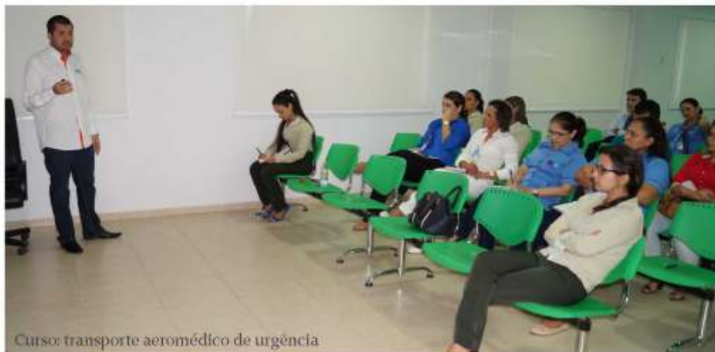
Curso: transporte aeromédico de urgência