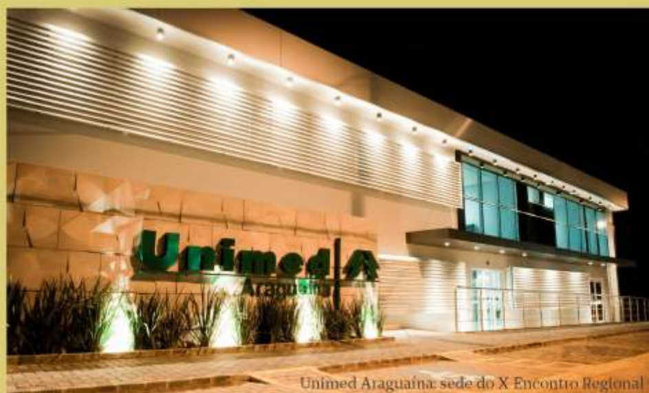
Unimed Araguaína: sede do X Encontro Regional

federadas vão se reunir no dia 14 de agosto na Unimed Cerrado, em Goiânia (GO), no I Encontro dos Dirigentes das Unimed de Goiás, Tocantins e Distrito Federal.