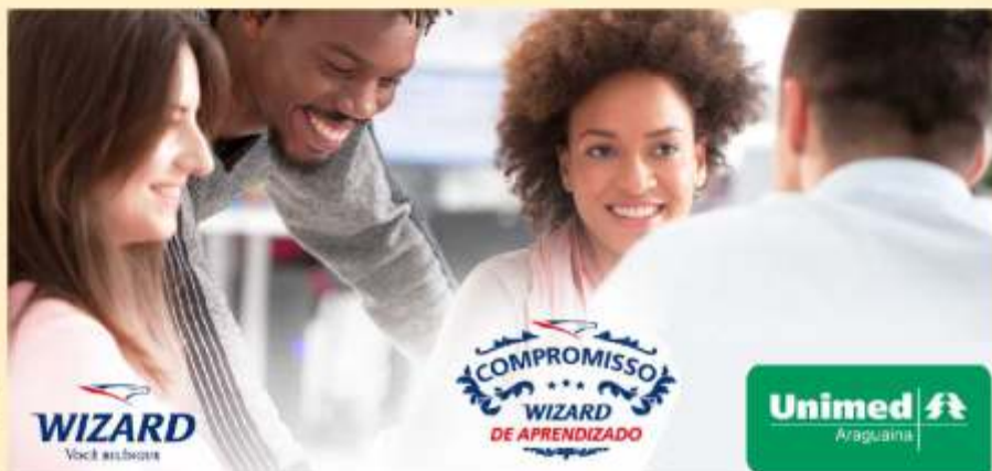
A maior rede de ensino de idiomas do mundo agora é parceira da Unimed Araguaína, oferecendo 30% de desconto nas parcelas de cursos para seus clientes e funcionários.

A parceria firmada entre a Unimed Araguaína e escola de idiomas Wizard beneficia clientes, cooperados e colaboradores da cooperativa com descontos e condições especiais nas matrículas e mensalidades. Para usufruir do benefício, basta que o interessado procure a Wizard Araguaína, na Avenida Paranaíba, 1435, Setor Central, e apresente o cartão Unimed e um documento de identificação com foto. Depois, é só escolher o curso ou cursos desejados e se matricular na Wizard, que é considerada a maior rede de escolas de idiomas do mundo e oferece cursos de inglês, espanhol, francês, italiano, alemão, português para estrangeiros, japonês e chinês.