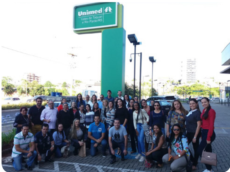
Unimed Vale do Taquari e Rio Pardo