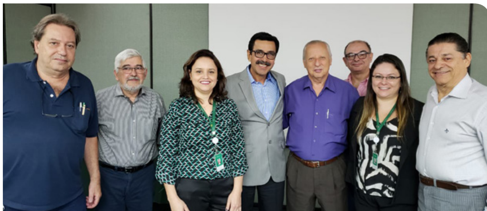
Visita à Federação das Unimed's do Estado do Rio Grande do Sul

E m busca de novos conhecimentos, compartilhamento de informações e exemplos de sucesso que possam contribuir para o aperfeiçoamento da gestão e para implantação no futuro hospital da cooperativa, diretores e representantes do departamento Jurídico da Unimed Araguaína participaram de uma visita técnica ao Rio Grande do Sul. Nos dias 3 e 4 de dezembro, a diretoria e os técnicos estiveram em Porto Alegre e em Caxias do Sul.