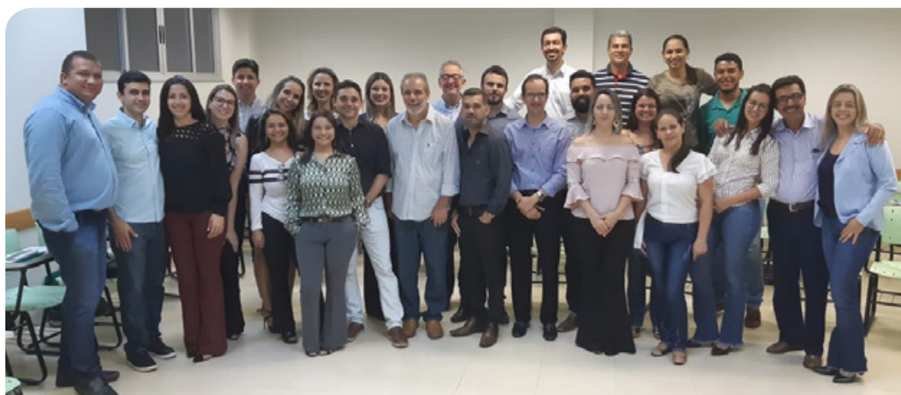
Pós-graduação: aula inaugural

A aula inaugural para a turma formada por dirigentes, cooperados e colaboradores aconteceu no dia 23 de novembro. O objetivo desta pós-graduação é capacitar os alunos para a tomada de decisões no exercício de funções relati-