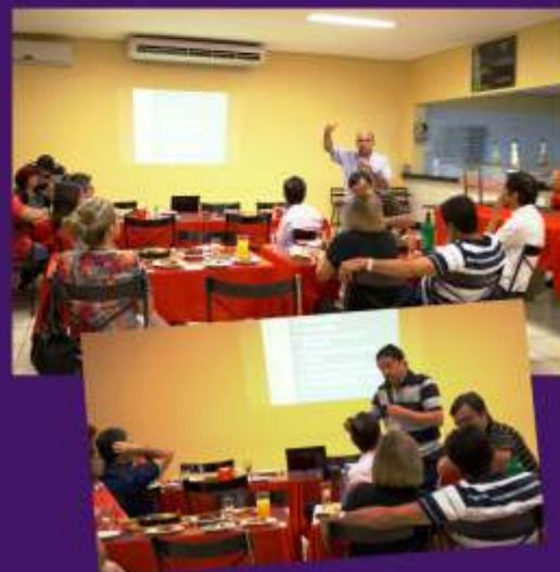
Reunião: maior aproximação entre diretores e cooperados

Trinta e três cooperados participaram da reunião, que aconteceu em clima de confraternização. Além de dar maior transparência ao trabalho da cooperativa, a promoção de encontros como esse estreita o relacionamento entre os cooperados e a diretoria da Unimed Araguaína.