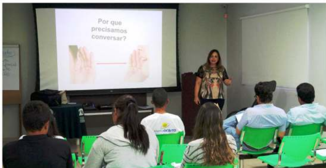
Sexto módulo: comunicação assertiva em pauta

“ Dando sequência ao curso iniciado em 2014 e com encerramento previsto para maio, a Unimed Araguaína sediou, neste início de ano, mais três módulos do Gescoop