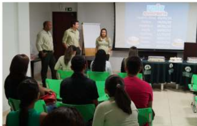
Fevereiro: festa com comemoração e intercooperação

A celebração dos aniversários dos diretores e colaboradores é sempre motivo de festa na Unimed Araguaína. A cada mês, um departamento fica encarregado de organizar a comemoração, que acontece em clima de cooperação, brincadeira, diversão e muita alegria.