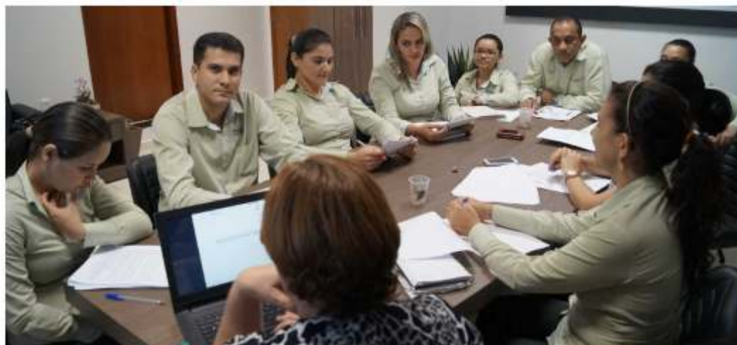
Cursos: capacitação dos multiplicadores e dos auditores internos