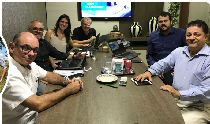
Diretores e arquitetos: reunião e visita ao terreno

Aprovada em dezembro passado, a construção do Hospital da Unimed Araguaína vem avançando a cada dia. Logo após a escolha da L+M Empreendimentos para a elaboração do projeto da obra, os arquitetos da empresa já colocaram as mãos na massa e, no dia 7 de maio, fizeram a primeira apresentação do projeto arquitetônico do novo hospital aos diretores da cooperativa.