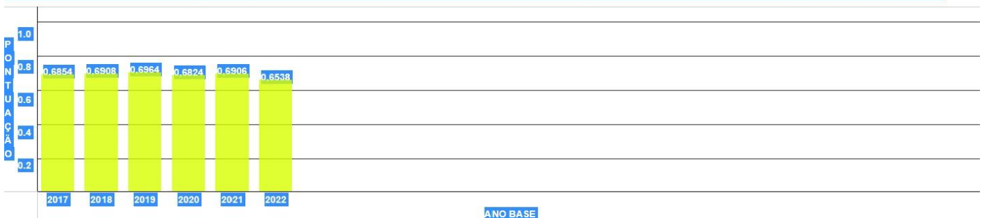
Gráfico de evolução do IDSS

totalmente comparáveis com os anos anteriores.