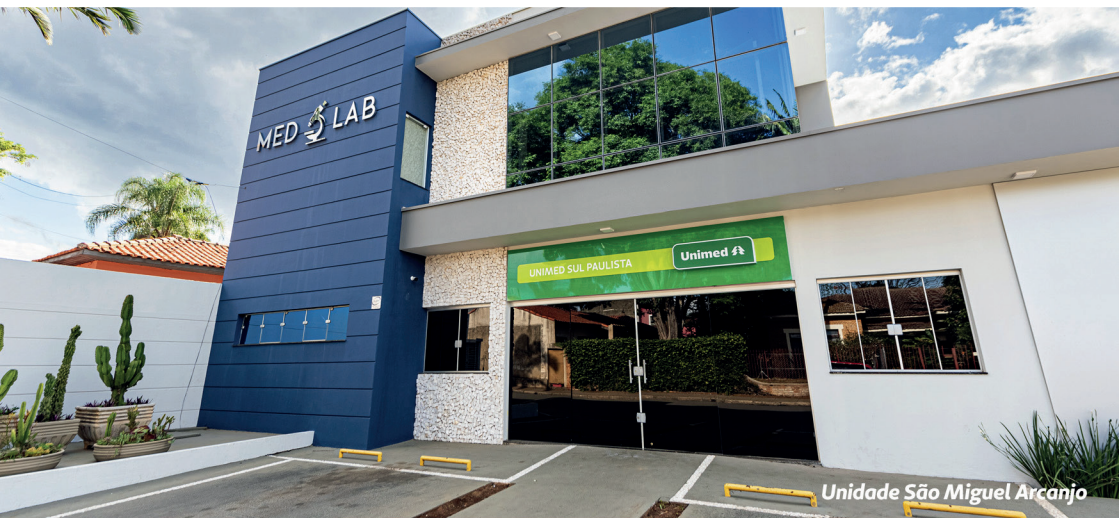
Unidade São Miguel Arcanjo