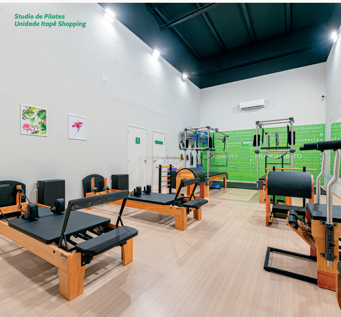
Studio de Pilates Unidade Itapê Shopping