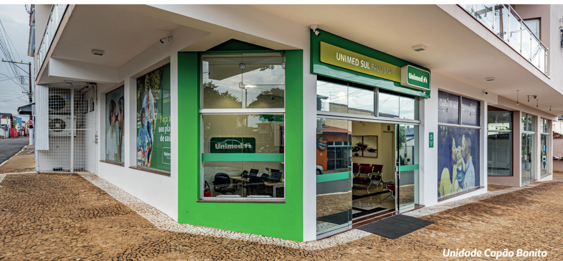
Unidade Capão Bonito