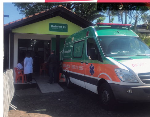
Casa de Saúde da Unimed na Oktoberfest