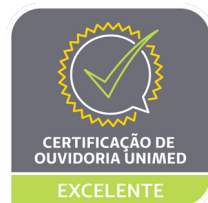
Selo Ouvidoria de Excelência