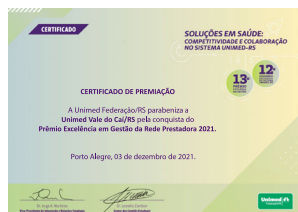
Prêmio Excelência em Gestão da Rede Prestadora - Unimed Federação/RS