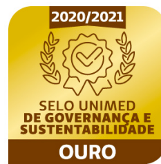
Selo Ouro Unimed de Governança e Sustentabilidade