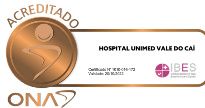
Acreditação ONA Nível I