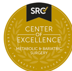
Certificação em Cirurgia Bariátrica e Metabólica SRC - Surgical Review Corporation