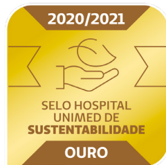
Selo Ouro Hospital Unimed de Sustentabilidade