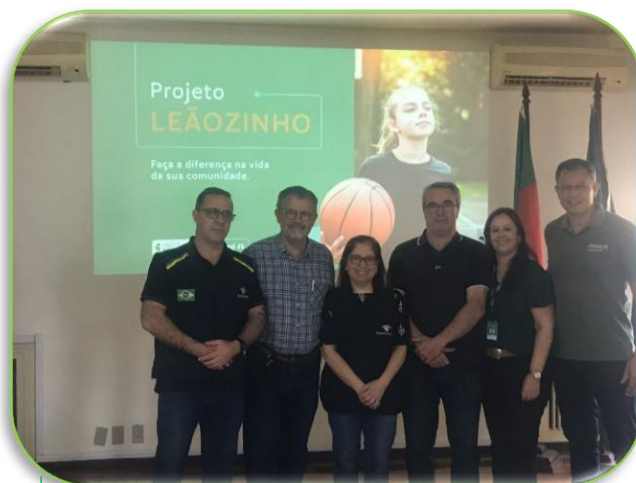
Parceria com a Receita Federal