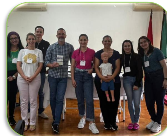
Curso de PALS