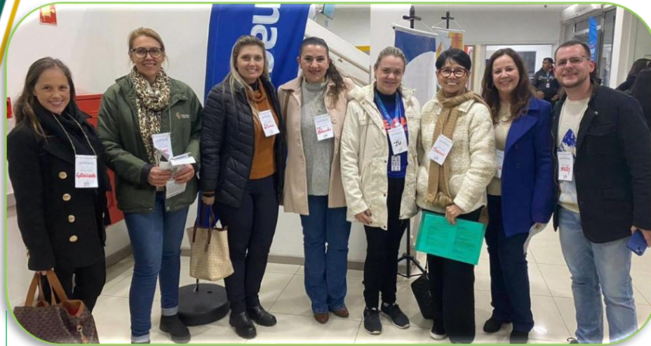
Feira de Projetos do Senac