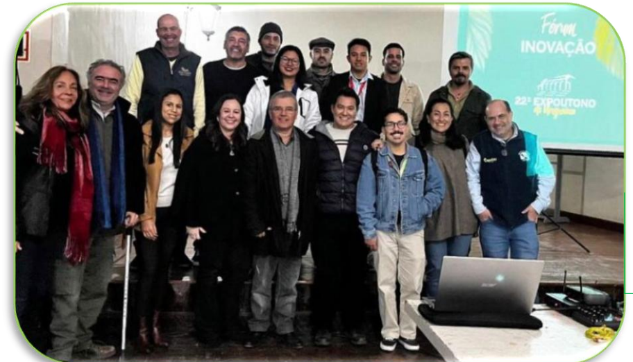
Fórum de Inovação na Expoutono