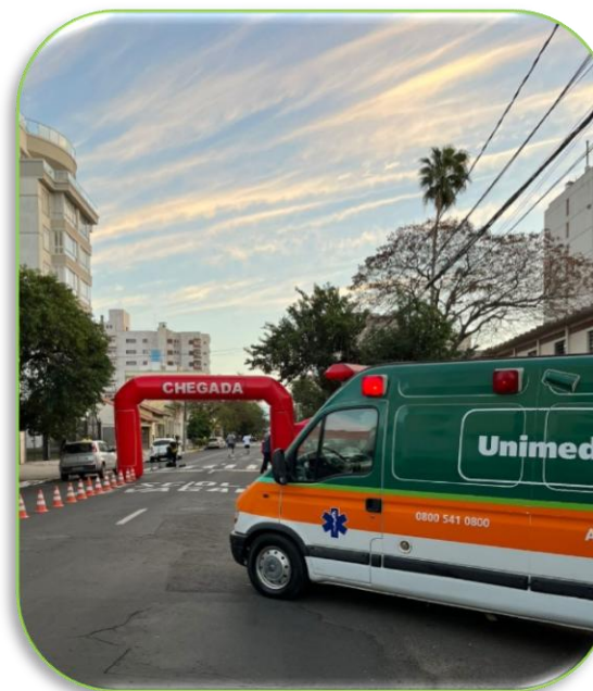
Apoio SOS na Corrida do Instituto Romagueira Correa