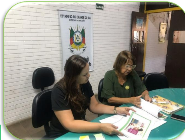
Parceria com a 10ª Coordenadoria Regional de Educação