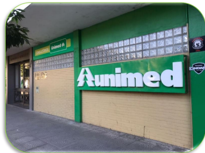
Consultório Clínico Unimed-4B