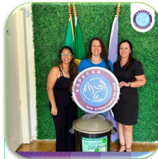
Parceria com AAPECAN- Projeto Tampinha Solidária