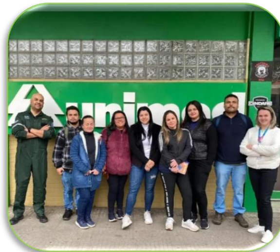
Curso de APH