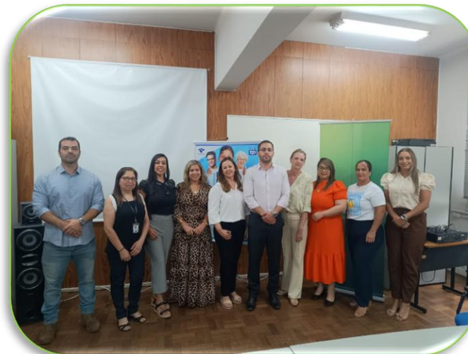
Reunião para Contadores