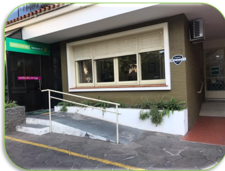
Espaço Viver Bem