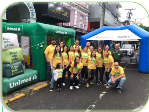
Apoio Corrida Modapé