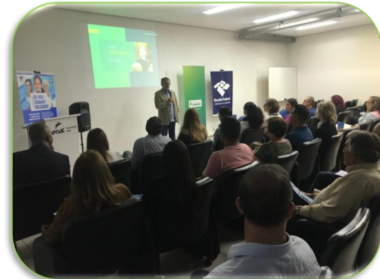
Café do Projeto Leãozinho