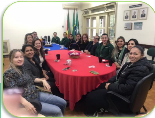
Dia das Mães