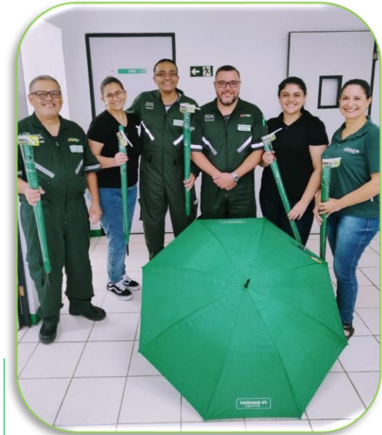
Dia do Trabalho