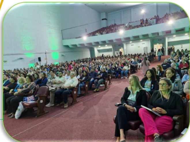
Fórum de Saúde