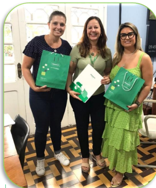
Secretaria de Saúde