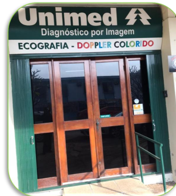
Clínica de Imagem