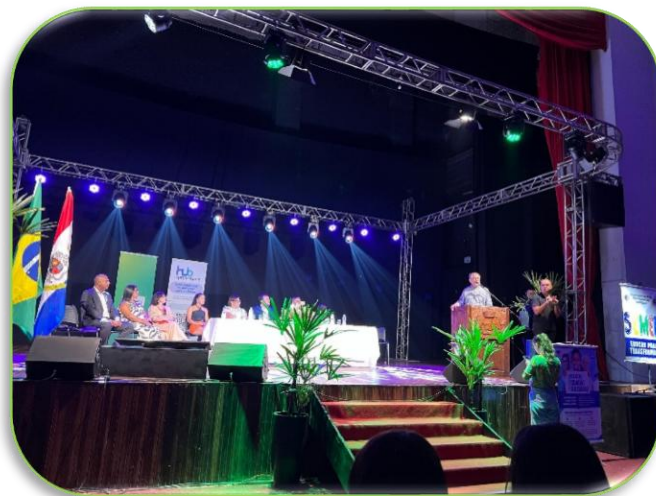
Abertura do Ano Letivo Municipal