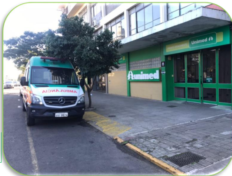
Pronto Atendimento 24 horas