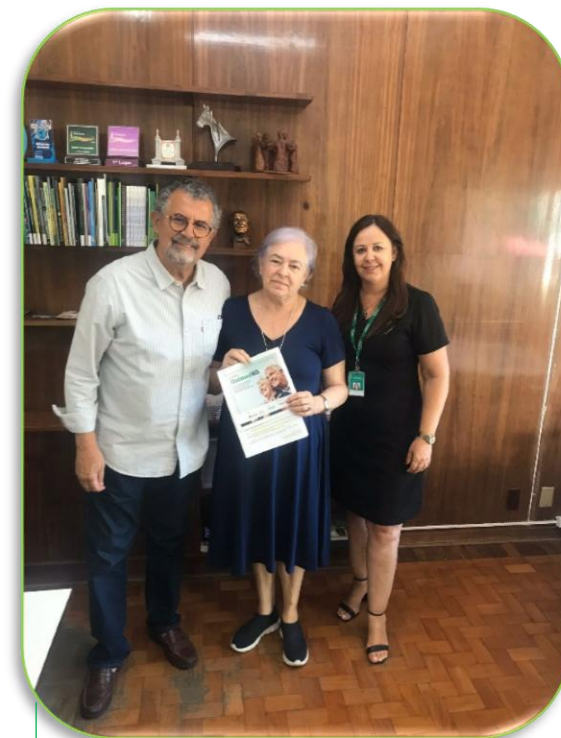
Divulgação do Edital 60+