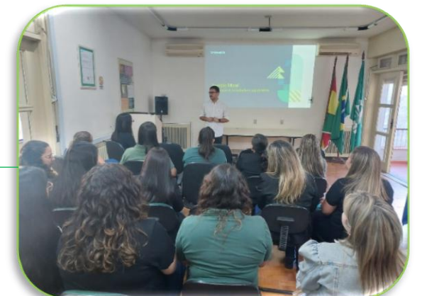
Dia da Mulher