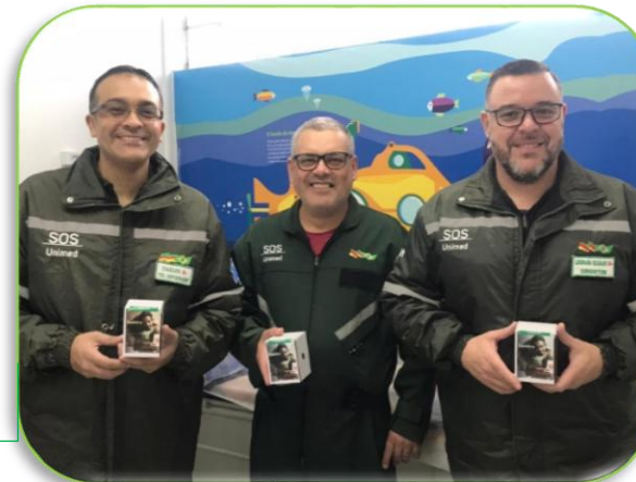
Dia dos Pais