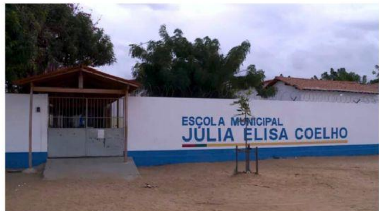
Por telefone, o gestor, que foi afastado das funções pela Secretaria Municipal de Educação, disse que só iria se pronunciar após conclusão do inquérito.

Em casos suspeitos de abuso sexual, as denúncias podem ser feitas nos Conselhos tutelares de qualquer município. Em Petrolina, os telefones são o 3862-2022 ou o do plantão do Conselho, o 98861-0421. As denúncias também podem ser feitas ao Creas, pelo número 3861-5371.