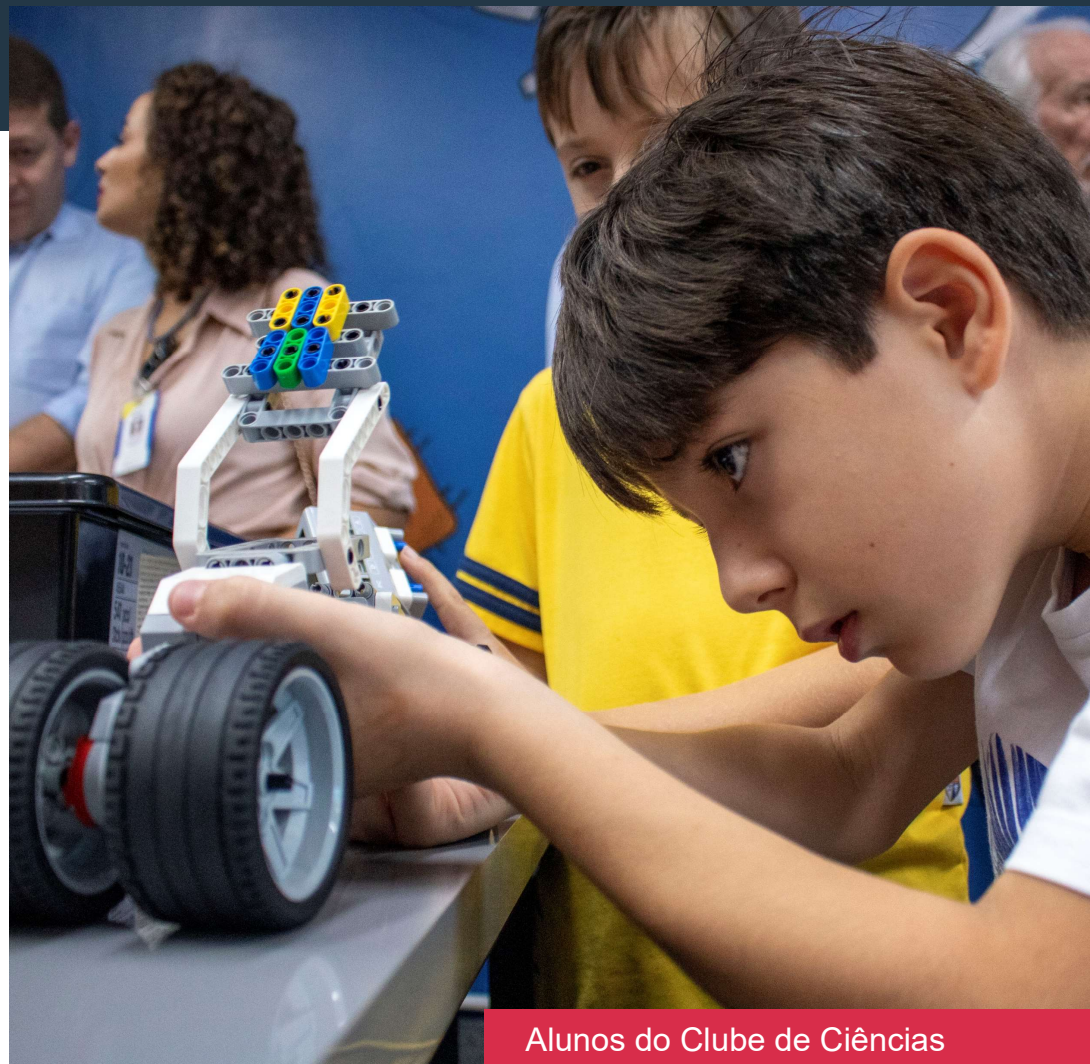
Alunos do Clube de Ciências durante aula de Robótica

Finalista do Prêmio da IASP, em 2022. Resultados será anunciado em setembro