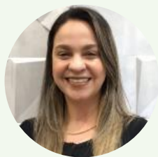
Daniely Fst. Coordenação