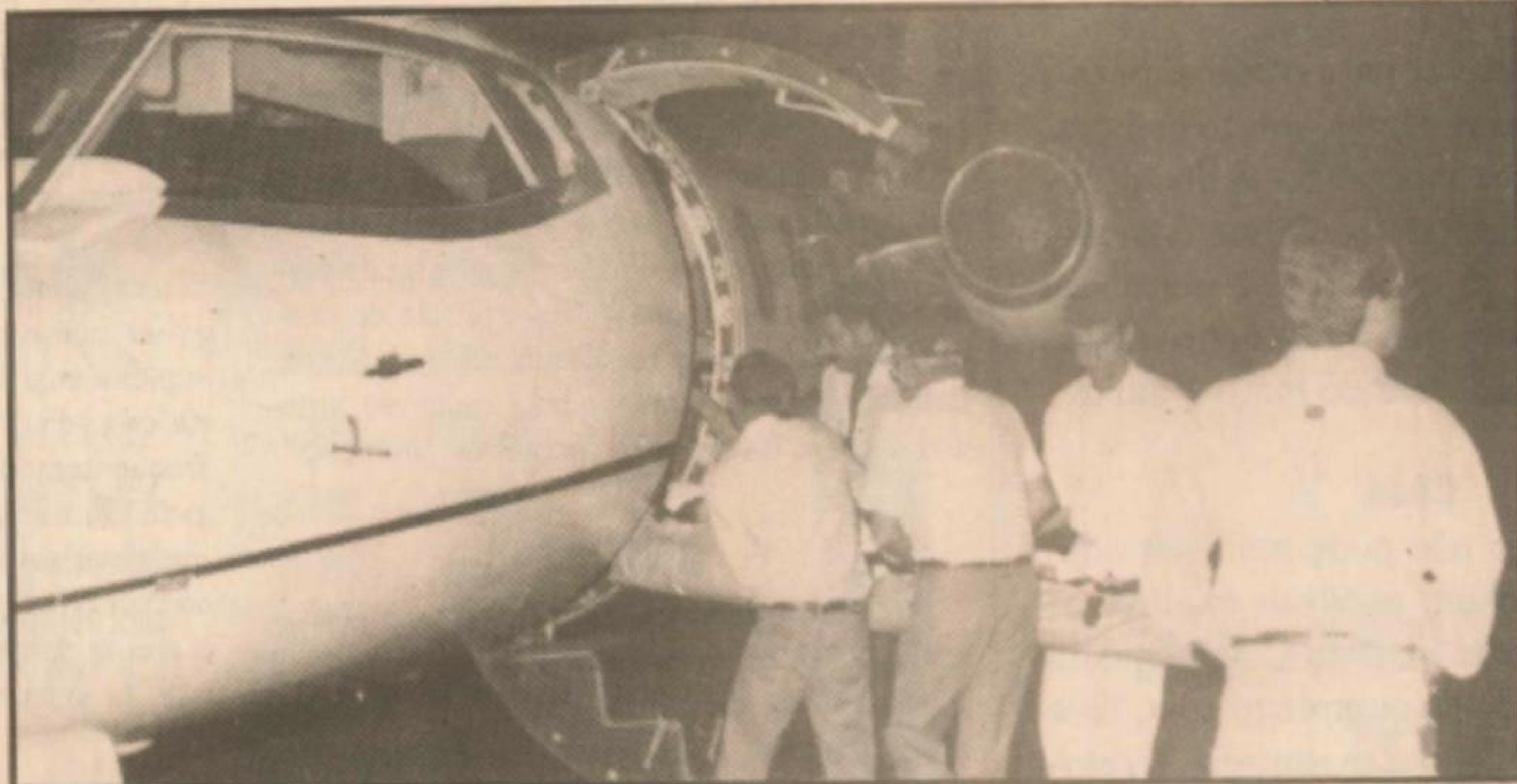
Momento em que a paciente estava sendo carregada no Jato Learjet 55

Para transportar pacientes de alto risco, a Unimed Air possui helicópteros e jatos Learjet 55, equipados com UTI a bordo, médico e enfermeira, garantindo a seus associados um acesso rápido e confiável ao melhor hospital, à melhor equipe médica e ao melhor equipamento, estejam onde estiverem. Na hora marcada o Jato Learjet estava no aeroporto Juvenal Cardoso, em Pato Branco, de onde transportou uma paciente para o Instituto Médico de Curitiba, em apenas 28 minutos. Por ética médica o nome e a doença da paciente não foram