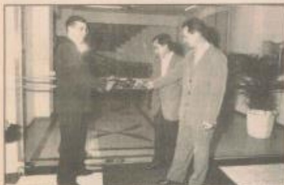
Momento em que o prédio foi oficialmente inaugurado