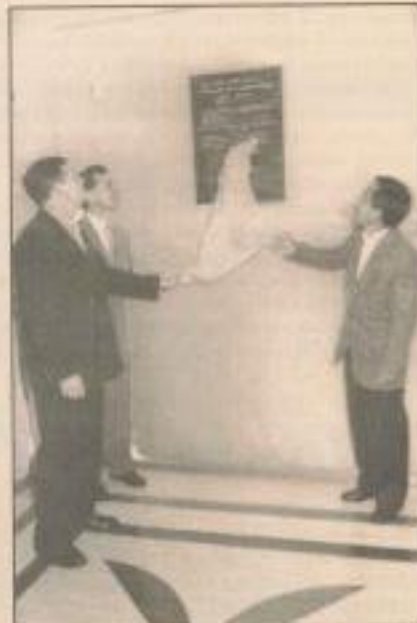
A placa comemorativa foi colocada na entrada da sede

Esta confiança é a mesma que a diretoria da Unimed possui em relação ao desenvolvimento de Pató Branco e de toda a região Sudoeste, pois viabilizar a construção de um empreendimento nessa propoção é, realmente, uma amostra disso.