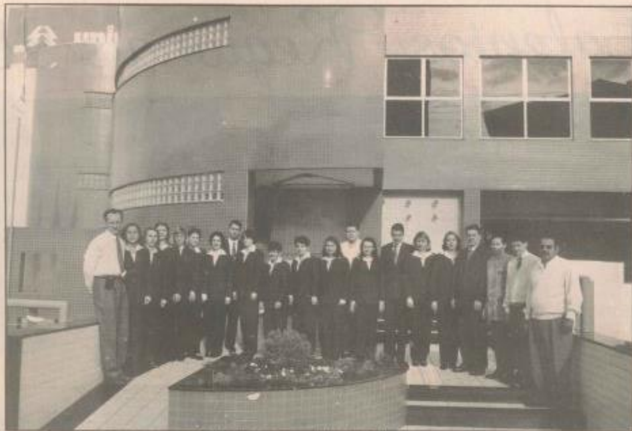
A equipe de funcionários da Unimed Pato Branco, eficiência e dedicação

O Sistema Nacional Unimed é um sistema cooperativista fundado e dirigido por médicos, com finalidade de oferecer assistência médica, serviços complementares e hospitalares a todos os seus usuários, através de uma rede de profissionais e serviços do mais alto gabarito, através das UNIMEDs distribuídas em todo o país.