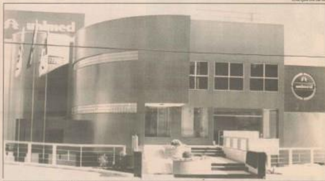
Nova sede apresenta linhas arrojadas, que marcam a região

Após o descerramento da faixa inaugural na porta de acesso e de uma placa no interior do prédio, os convidados puderam conhecer as novas instalações da Unimed. A nova instalação possui 2000 metros quadrados distribuídos por cinco andares. O empreendimento custou cerca de R$ 1.300.000,00 e conforme destacou o