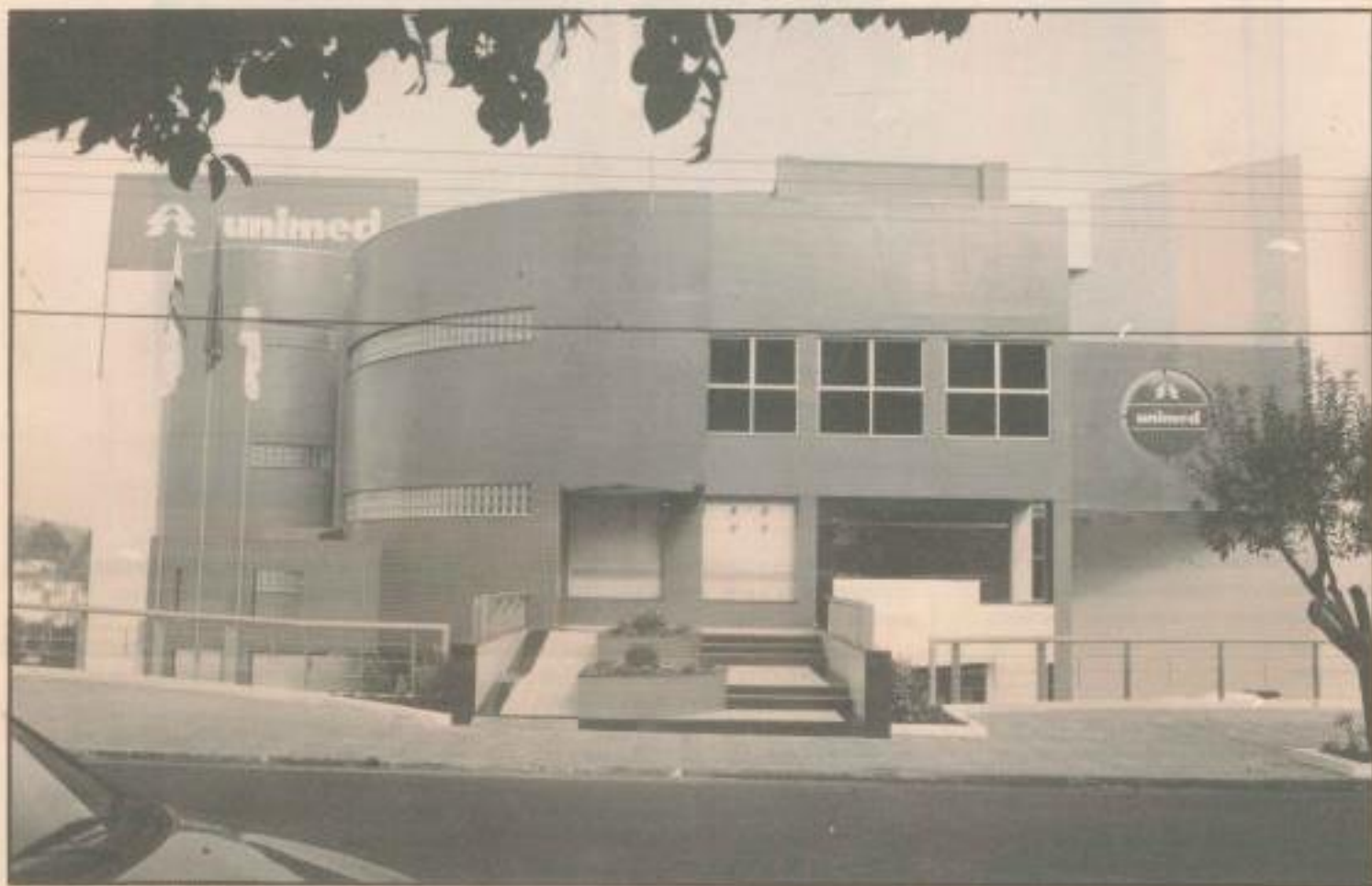
A obra apresenta linhas arrojadas, que marcam a região