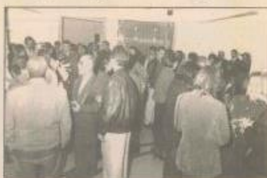
Vários convidados presenciaram o evento